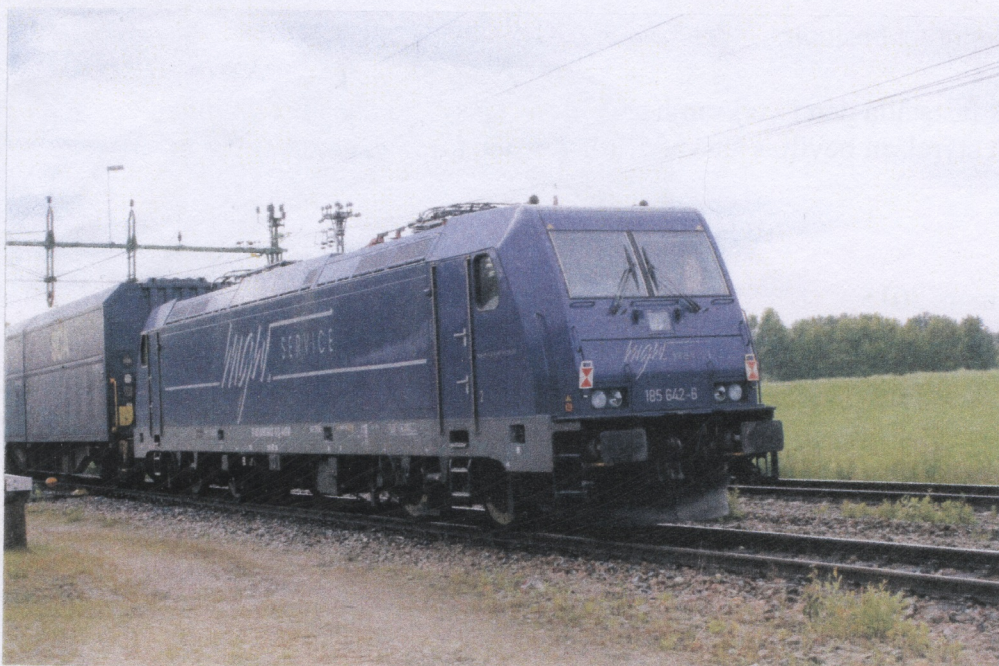
I Björnsjö passerar många loktyper här MGW Service 185 642-6 Den 14 juli 2015