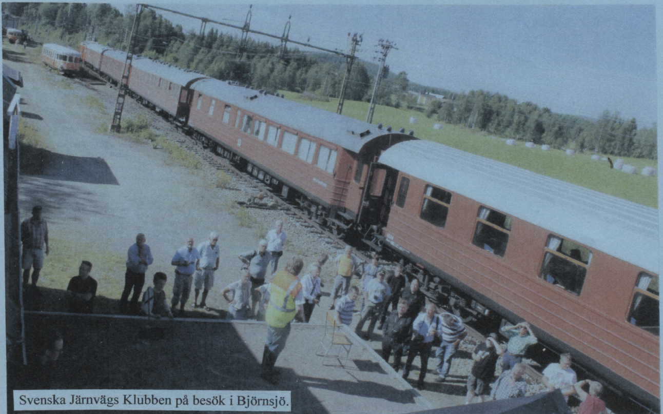
Svenska Järnvägs Klubben på besök i Björnsjö.