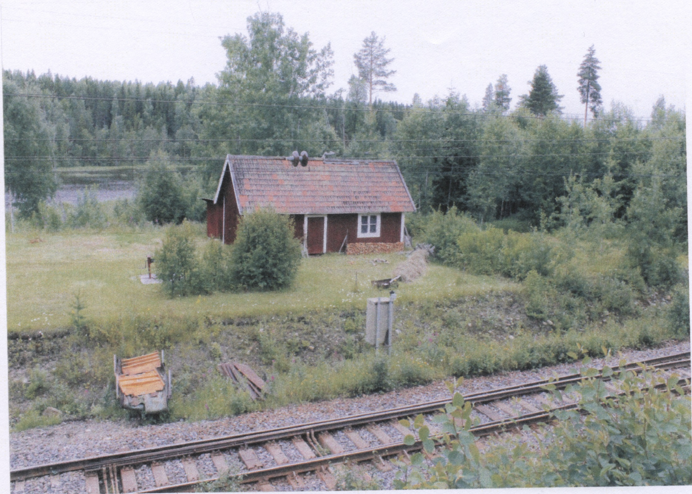
Banvakt stuga i Kälvattnet den 14 juli 2015.